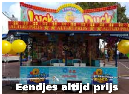
Eendjes altijd prijs