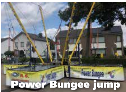
Power Bungee jump